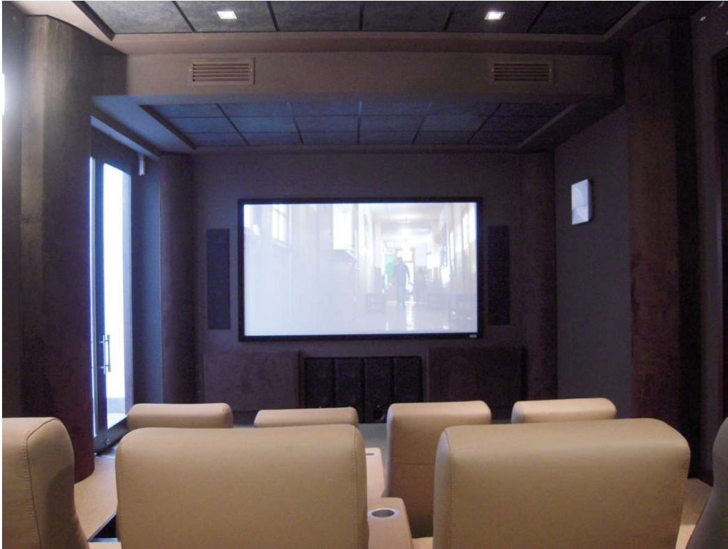
Esquineros acústicos en Home Theater