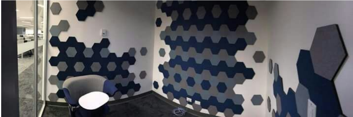
Acondicionamiento acústico con Cronatur Hexa de la sede central de HP (Hewlette Packard) en San José de Costa Rica. (Costa Rica).