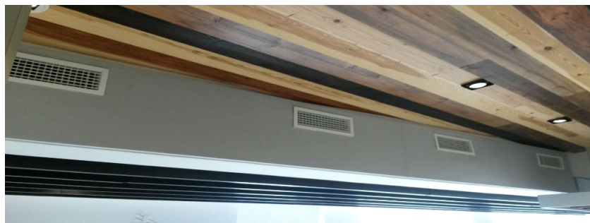
Restaurante El Campero. - Barbate de Franco (Cádiz)

Los paneles CROXON DEGAS se limpian con un paño humedecido.