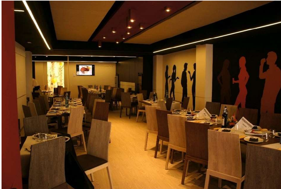
Paneles CROXON DEGAS con alojamientos leds. Restaurante DiTrevi. Villena (Alicante).