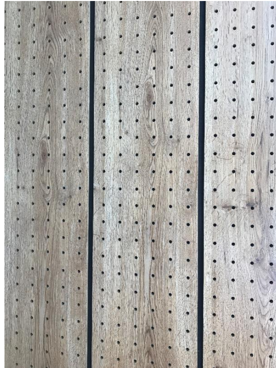
Modelo Panel ECOKAN tipo listones (200 mm/ separación 10 mm)