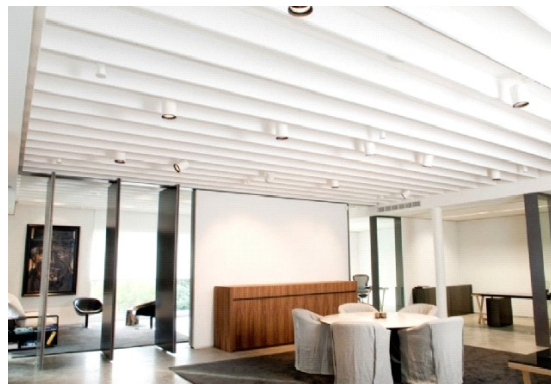
Instalación Croxon Baflox (Madrid)

Los baffles absorbentes CROXON BAFLOX son ideales para zonas donde la reverberación procedente de las superficies rígidas es un problema. Estos baffles están diseñados para suspenderlos en espacios abiertos y reducir el eco y los tiempos de reverberación que con frecuencia inundan los gimnasios, fábricas, aulas, cines, hoteles, polideportivos, salas de conferencias, piscinas, restaurantes, iglesias, etc.